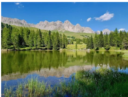
il magico Lago del Passo San Pellegrino

Le escursioni si dividono in vari livelli, in base alla difficoltà dell'attività che viene proposta: